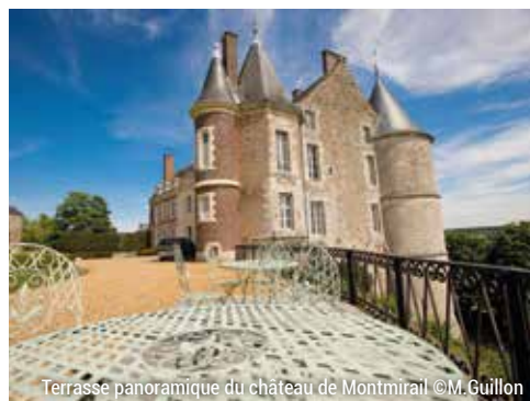
Terrasse panoramique du château de Montmirail