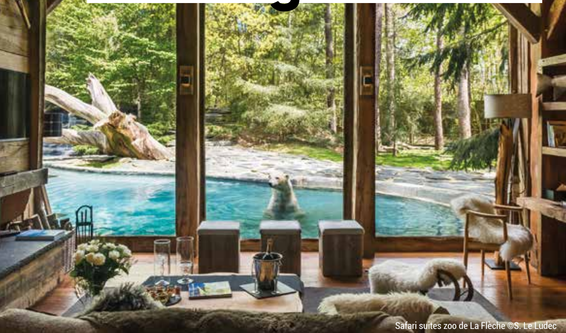
Safari suites zoo de La Flèche

Envie de dépaysement ? Découvrez des idées de séjours insolites pour vos vacances !