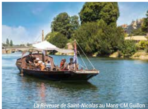
La Rêveuse de Saint-Nicolas au Mans ©M. Guillon