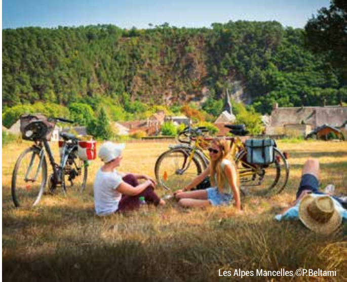
Les Alpes Mancelles

www.sarthetourisme.com/incontournables/les-alpes-mancelles