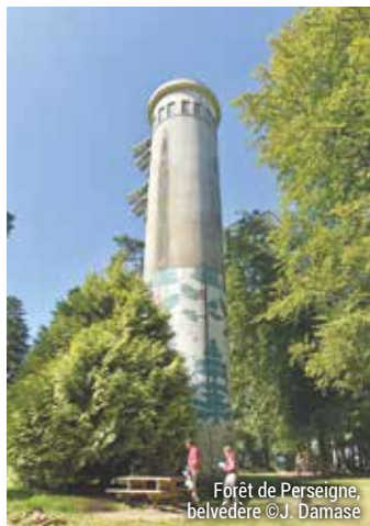
Forêt de Perseigne, belvédère