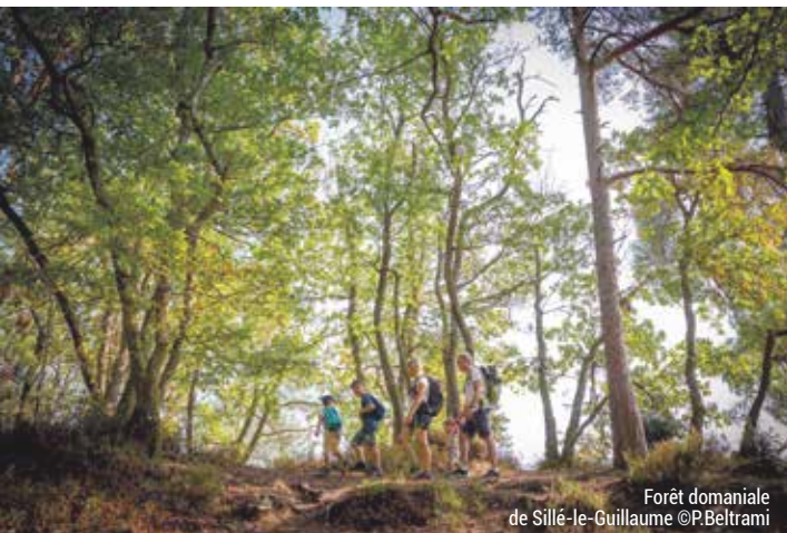
Forêt domaniale de Sillé-le-Guillaume

Découvrez les paysages sarthois au rythme naturel de l'homme. Vous apprécierez la variété des chemins de randonnée (bocages, forêts, chemins creux, zones humides et reliefs escarpés) et un patrimoine rural riche de villages pittoresques.