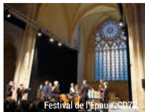
Festival de l'Épau