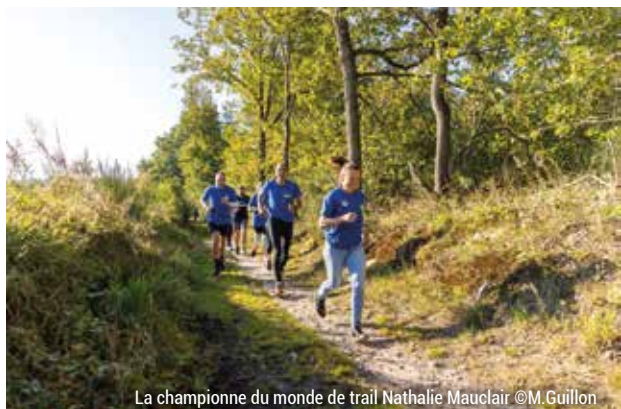
La championne du monde de trail Nathalie Mauclair