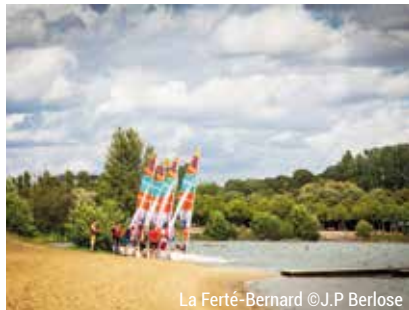
La Ferté-Bernard

Vous voulez passer une belle journée en famille ? Les plages des bases de loisirs et des piscines pourvoient à toutes vos envies : activités nautiques, farniente, pêche... Et vous pourrez même faire du vélo à proximité !