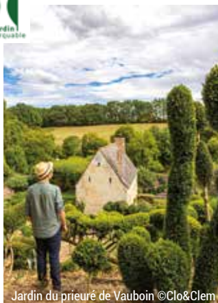
Jardin du prieuré de Vauboin

Flânez dans les sept jardins remarquables de la Sarthe et vivez une parenthèse bucolique et poétique : le prieuré de Vauboin (1 er prix de l'Art du Jardin 2020), les jardins du donjon de Ballon, du Petit-Bordeaux, du château du Lude, du château de Villaines, du château du Mirail et le jardin Renaissance de Poncé-sur-le-Loir. Tous vous enchanteront !