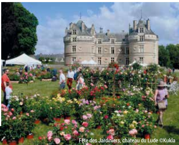
Fête des Jardiniers, château du Lude