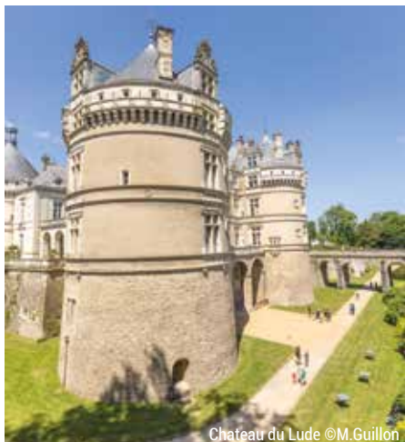
Château du Lude

19 BOUCLES LOCALES à faire en une journée complètent l'offre avec la possibilité de découvrir la Voie verte du Saosnois, la Forêt d'Exception de Bercé et le Perche sarthois.