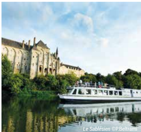
Le Sablésien

Partagez une traversée à bord du bateau-croisière Le Sablésien . Embarquez à Sablé-sur-Sarthe pour une croisière. Au cours d'un agréable repas ou d'un apéro, découvrez des manoirs cachés dans des écrans de verdure.