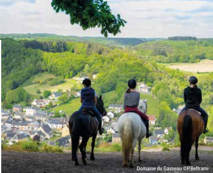
Domaine du Gasseau

Découvrez les centres équestres sur : www.sarthe-tourisme.com/randonnees-equestres