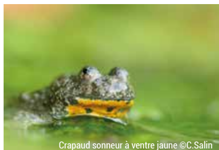
Crapaud sonneur à ventre jaune