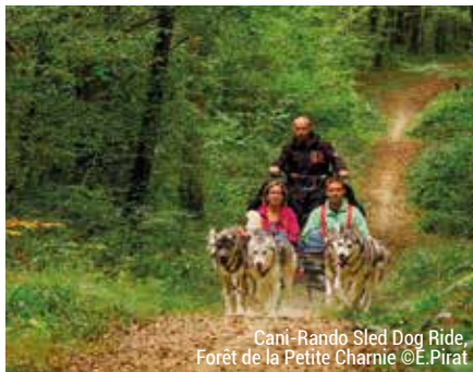
Canï-Rando Sled Dog Ride, Forêt de la Petite Charnie

EN FORÊT DE LA PETITE CHARNIE OU DANS LE BOCAGE SARTHOIS