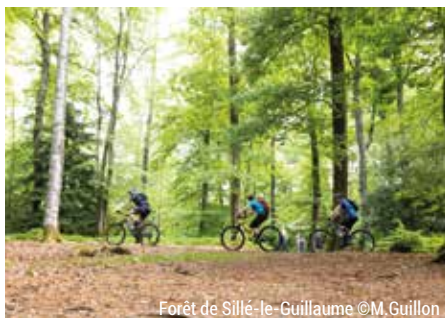
Forêt de Sillé-le-Guillaume