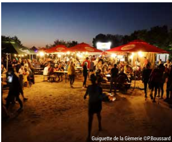
Guinguette de la Gèmerie