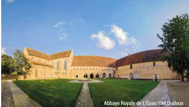
Abbaye Royale de l'Épau